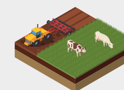
Recuperação de Pastagens Degradadas (RPD)

A RPD consiste em técnicas que promovem a recuperação da capacidade produtiva das pastagens degradadas, proporcionando incremento na produtividade das espécies forrageiras.