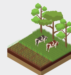
Sistema de Integração Lavoura-Pecuária-Floresta (ILPF)

Os sistemas ILPF constituem uma estratégia de produção que integra diferentes sistemas produtivos, agrícolas, pecuários e florestais dentro de uma mesma área em cultivo consorciado, em sucessão ou em rotação, de forma que haja benefício mútuo para todas as atividades.