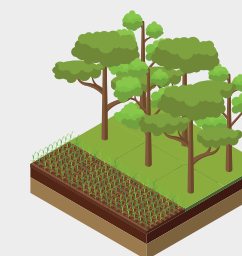
Sistema de Integração Lavoura-Floresta (ILF)